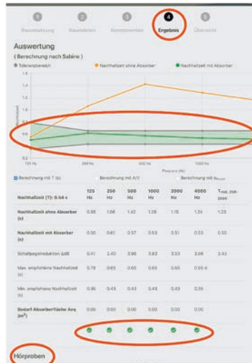
Den Raumakustik-Planer kann Buck Raum & Textil als FHR-Mitglied exklusiv nutzen.

Vorhangstoffe, Innensonnenschutz, Insektenschutz und die neuen Akustikpaneele. Um den Standort im Gewerbegebiet Riethäcker haben sich im letzten Jahrzehnt ein Bau-, Drogerie- und Heimtiermarkt sowie die TÜV-Prüfstelle angesiedelt. Entgegen ursprünglicher Befürchtungen erwies sich das Umfeld als