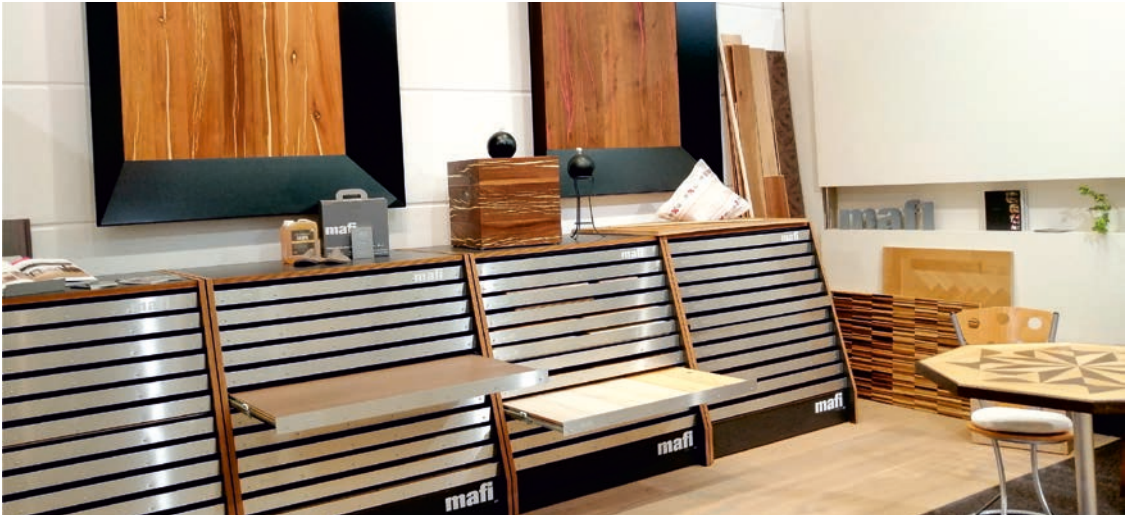
Beim Kauf von Parkett und anderen schallharten Belägen werden Kunden auf geeignete Akustiklösungen aufmerksam gemacht.

Nadelvlies gegen glatte Böden aus und verzichten auf Vorhänge. Die Sprachverständlichkeit leidet. In Großraumbüros entsteht ein hoher Lärmpegel durch die Belegung mit vielen Mitarbeitern, aber ohne schützende Einhausung. Ebenso vielfältig wie die Probleme sind aber auch die gestalterischen Möglichkeiten, die Akustik zu verbessern. Das ist ein idealer Job für einen Raumausstatter.