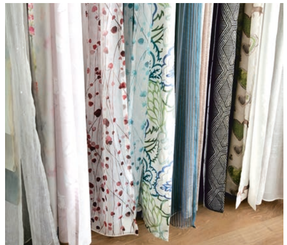
Textiler Sonnenschutz sowie Gardinen- und Dekostoffe sind auch Teil der Raumakustik-Planung.